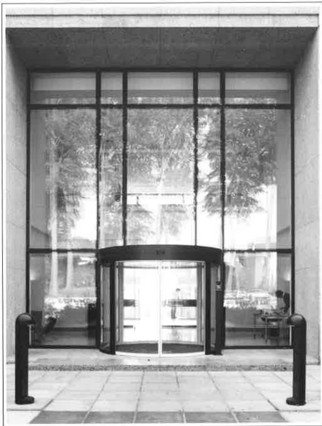
De inkom geïntegreerd in een hoge glaspertij

Uitnodigend én indrukwekkend is de Dow Corning-trap. Geïntegreerd in de halve cirkel van de glazen erker biedt hij de gebruikers een bekoorlijk zicht op het park en de vijvers. Intern biedt dit