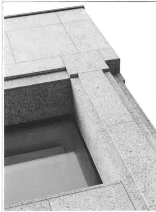
De gevel is een combinatie van Spaanse graniet en helder glas

Het gebouw is volledig uitgerust met verhoogde vloeren, geluidsdempende plafonds en full airconditioning.