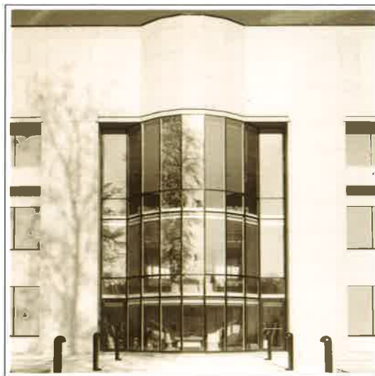
Dow Corning: "een beeldtaal die zeker uitnodigt tot verdere verdieping" (Trends)

Architect Van Ranst die het project begeleidde en die gedurende langere tijd in de V.S. werkzaam was (Architektenbureau W. Gropius te Boston) wees evenwel op belangrijke kultu-