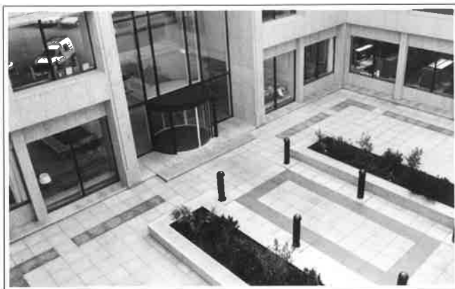
Uitkijk op een innemende binnentuin