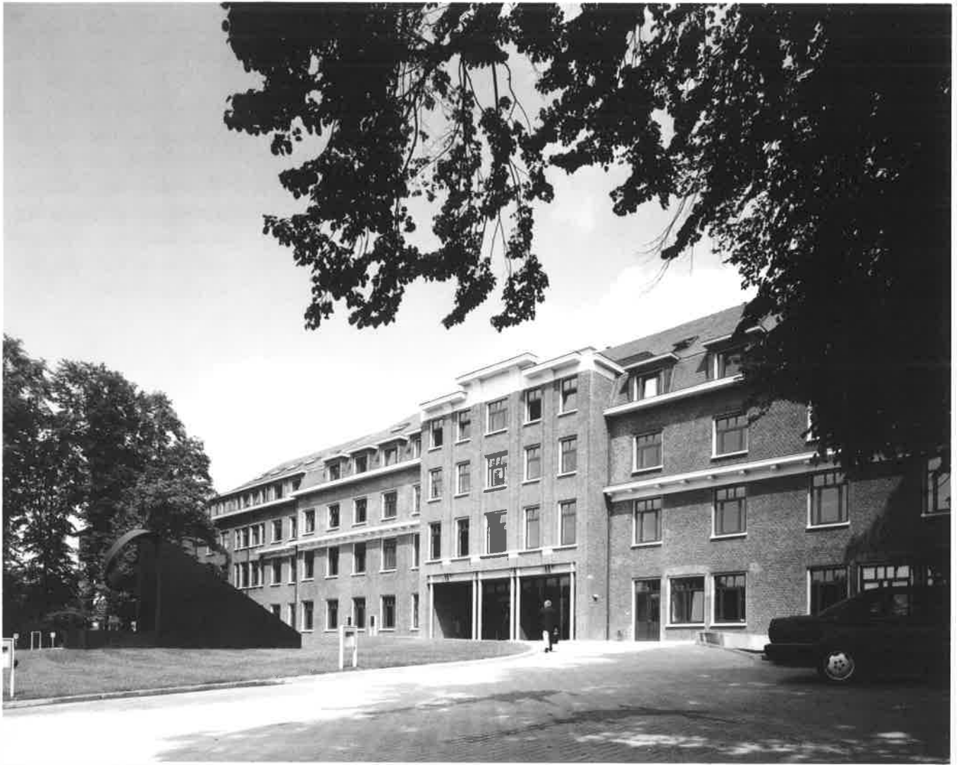
Exterieur, binnenzicht, ontwerp van de architecten.