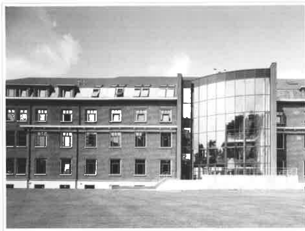
De metershoge glazen achtergevel biedt een ongehinderde kijk op het park.

De onmiddellijke nabijheid van de Antwerpse binnenring, de singel, de autosnelweg en de vlieghaven van Deurne, waarborgen een doeltreffende communicatie.