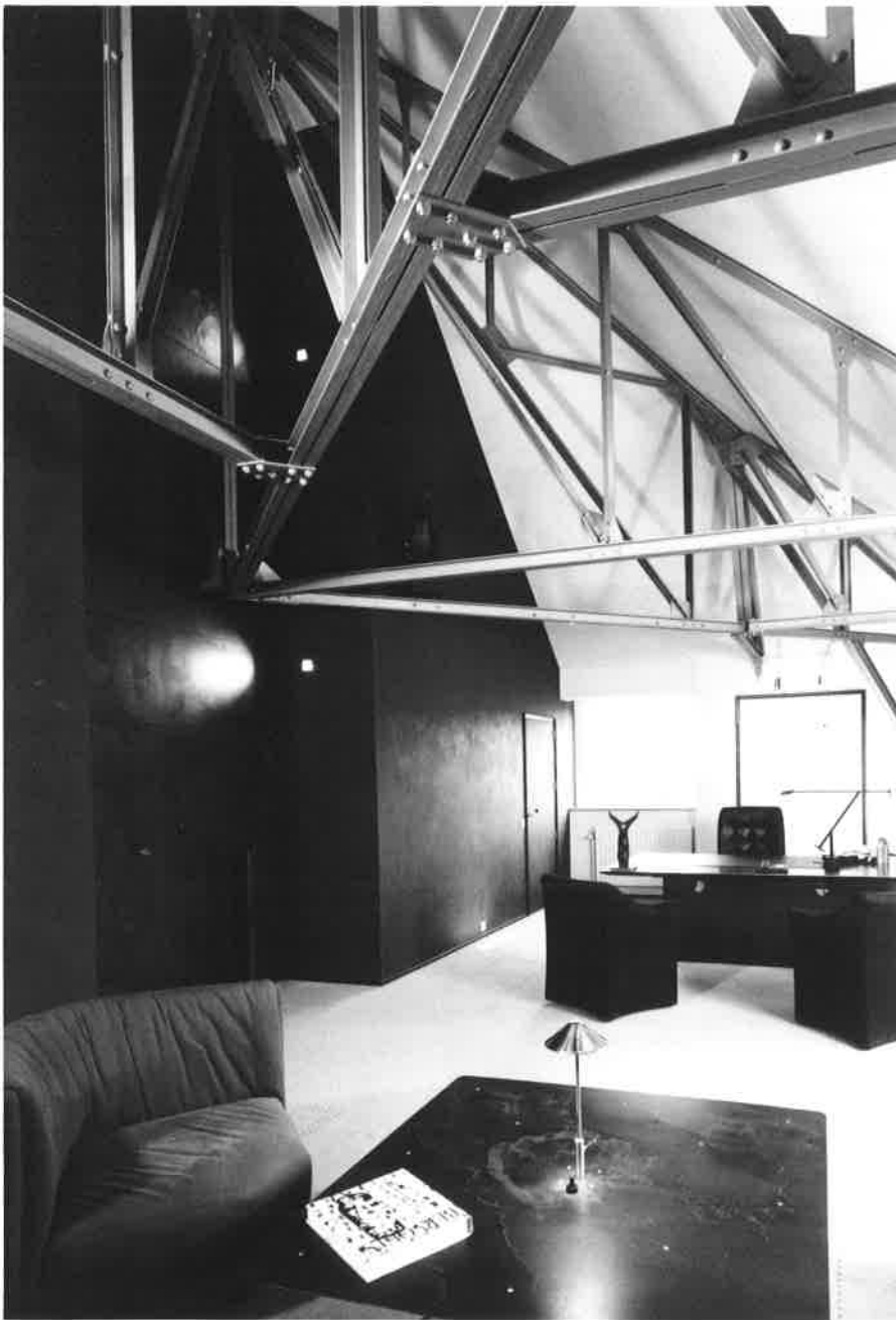
Het directiebuureau: respikt voor de oorspronkelijke metalen dakconstructie.

De Fabri Groep is een open huis. De inkom, over de volledige breedte van het centrale deel ontworpen in glas, benadrukt deze openheid. Een portiek gestut door metalen kolommen biedt beschutting voor de bezoeker en refereert meteen aan het materiaal dat de bouwheer passioneert: metaal.