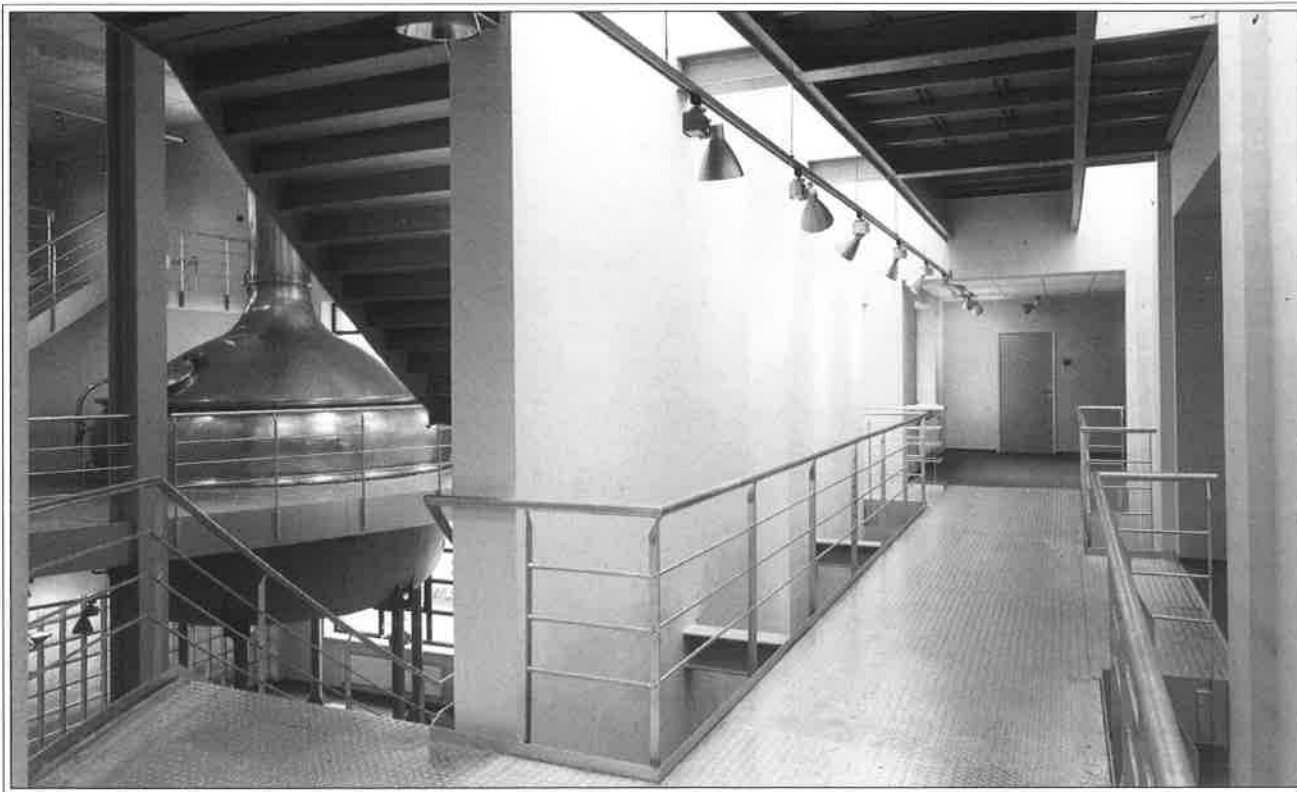
Het nieuwe gemeentehuis... hier werd ooit bier gebrouwen.