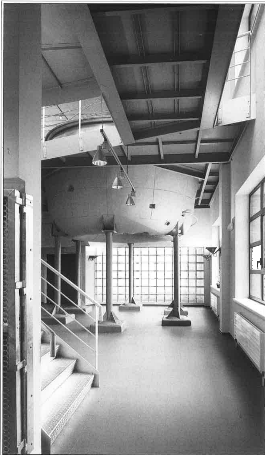
Metalen lichtarmaturen, trappen in verzinkt staal, glasdallen en stalen balken creëren een industriële toon.

Vandaag wordt op deze plek geen 'Golding Campina' of 'Abdijbier van Postel' meer gebrouwen, maar het renoveren van dit oude, vertrouwde gebouw tot een nieuwe, publieke ontmoetingsplaats, was wellicht het beste wat dit pand kon overkomen. De inwoners van Dessel werden uitgenodigd er een naam voor te suggereren. Het werd 'De Plaetse'.