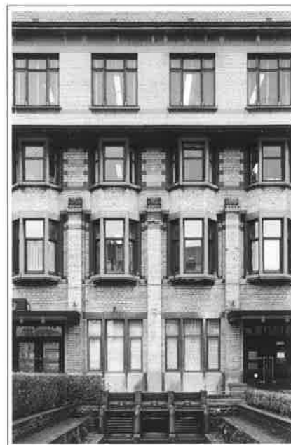
Sobere Art Deco waarin pilasters en erkerramen reliëf en ritme brengen.

The architects have the owner's supports and encouragement in their vision of respect for the original building, which has been moulded and refined in the light of new insights and needs without losing its own specific character.