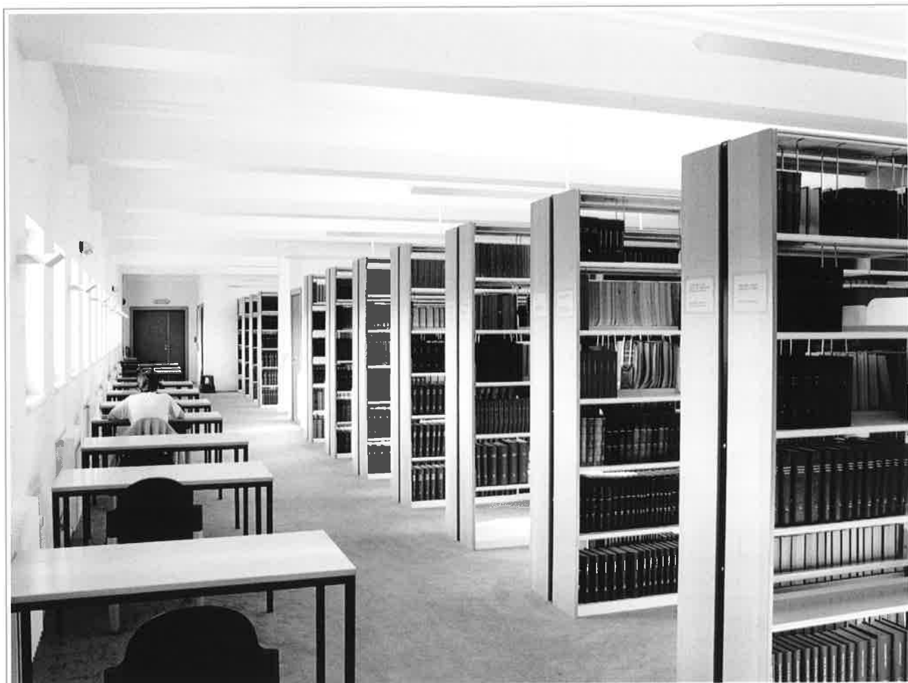
De bibliotheek: ruimte, licht en comfort voor de gebruikers.

De overige operationele ruimtes, gangen, zalen, werklokalen, polikliniek, laboratoria en bibliotheek en cafetaria, werden echter volledig nieuw gedacht. Licht, ruimte, comfort en doeltreffendheid voor de gebruikers stonden hierbij centraal. Getuige daarvan de bijzondere aandacht die uitging naar het interieur en de verlichting van de biblio-