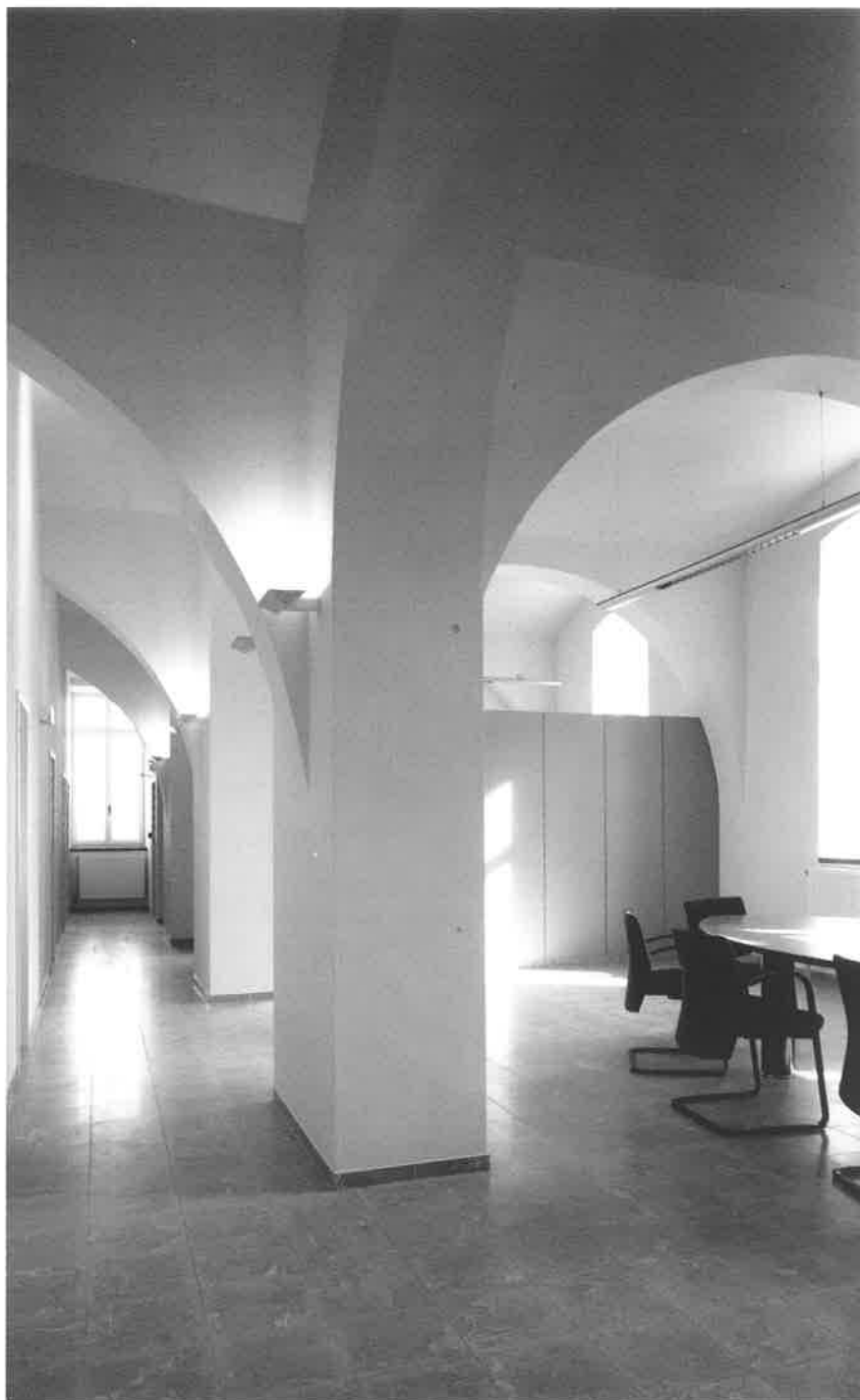
Gewelfbogen en steunpijlers creëren een gevoel van geborgenheid