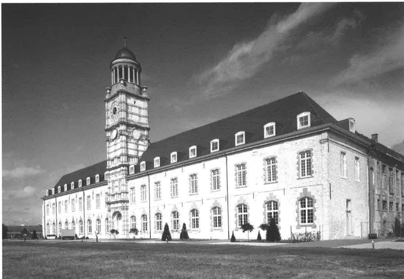
Aan de originele architectuur van het gevelbeeld werd niet geraakt

Enkele eeuwen later in de jaren 1920-1930, eveneens langs de Schelde, liet Alfred Cools, stichter van de Antwerpse Coöperatieve Vereniging voor de Huisvesting, sociale woningen optrekken. Bouwmeesters als Craeye, Smolders of Van Hoenacker ontwierpen er voor die tijd parels van 'sociale' architectuur met 'comfort' voor de bewoners. Zo ontstond een ganse wijk met een gelijkaardige stijl. Met gevelbeelden die qua vormtaal en -toon een sterke eenheid