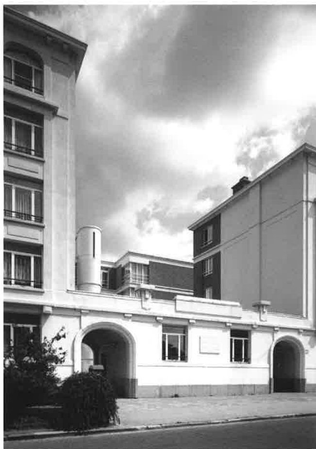
Gesloten vierkantformatie met doorgangen naar het binnenplein waar de kinderen veilig speelden

À Anvers, le Bureau d'architectes Storme Van Ranst a insufflé une nouvelle vie à deux sites historiques. Le premier est une ancienne abbaye cistercienne dont l'histoire remonte au XIII e siècle et qui a été transformée pour en faire un nouveau centre administratif communal. Le caractère de l'architecture originale, à mi-chemin entre une ferme-château et un couvent, ainsi que sa célèbre façade, a été entièrement préservé. Toutefois, les architectes y ont apporté de la clarté : toutes les petites pièces