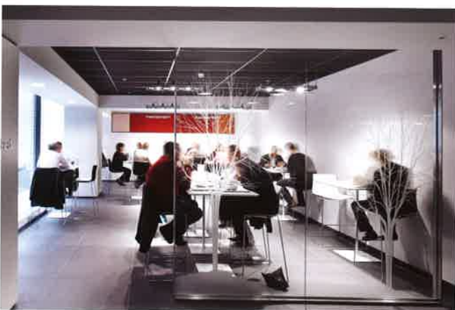
Aangenaam tafelen in het restaurant rond de centrale patio.

Aan het einde van het 85 meter lange atrium, bevindt zich het dubbel hoge bedrijfsrestaurant dat uitmondt in een patio met zenithaal licht. Elke dag worden hier tot 2000 maaltijden geserveerd. Tussen het restaurant en het atrium is de koffie- en sandwichbar geïntegreerd.