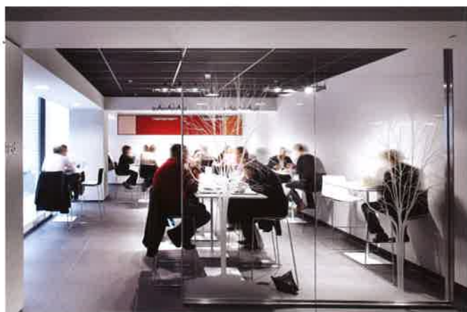
Aangenaam tafelen in het restaurant rond de centrale patio.

Aan het einde van het 85 meter lange atrium, bevindt zich het dubbel hoge bedrijfsrestaurant dat uitmondt in een patio met zenithaal licht. Elke dag worden hier tot 2000 maaltijden geserveerd. Tussen het restaurant en het atrium is de koffie- en sandwichbar geïntegreerd.