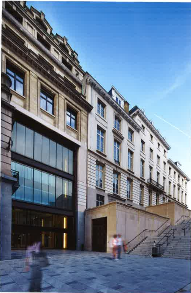
De nieuwe centrale hoofdingang, een hedendaagse inpassing in het historisch straatbeeld.