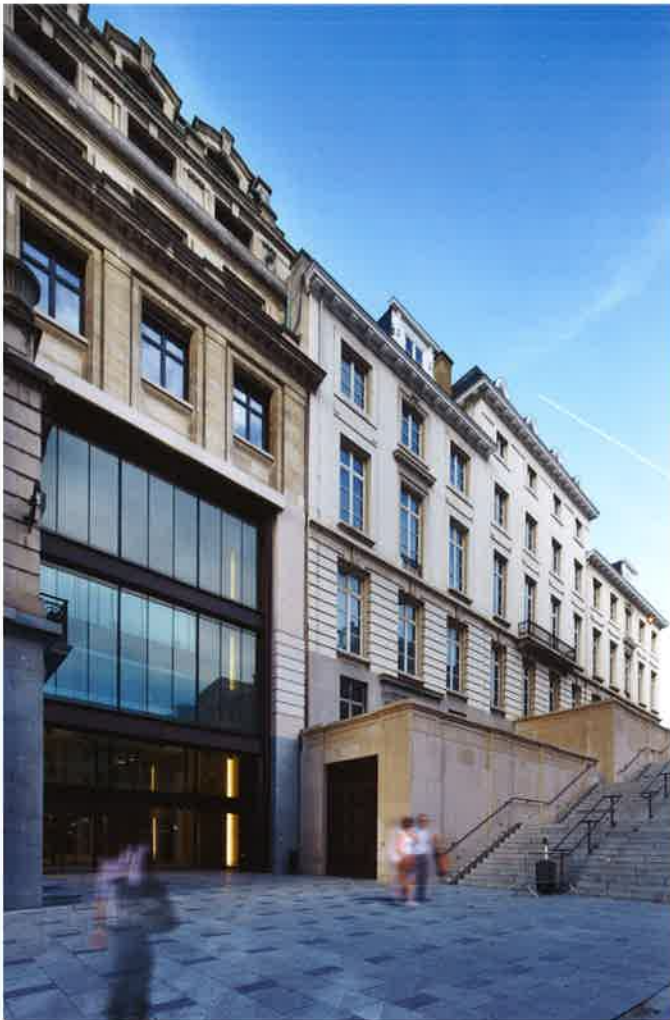
De nieuwe centrale hoofdingang, een hedendaagse inpassing in het historisch straatbeeld.