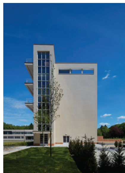
'Kopgevel met gerestaureerde beglaasde trapkoker.'

Een bijzondere uitdaging vormde het naadloos op mekaar afstemmen van de diverse regelgevingen van de agent-schappen Onroerend Erfgoed, Natuur en Bos, Zorg en Gezondheid en de vereisten met betrekking tot de brandveiligheid.