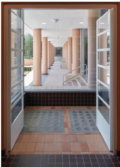
'Breed bemeten en open historische kuurterassen.'