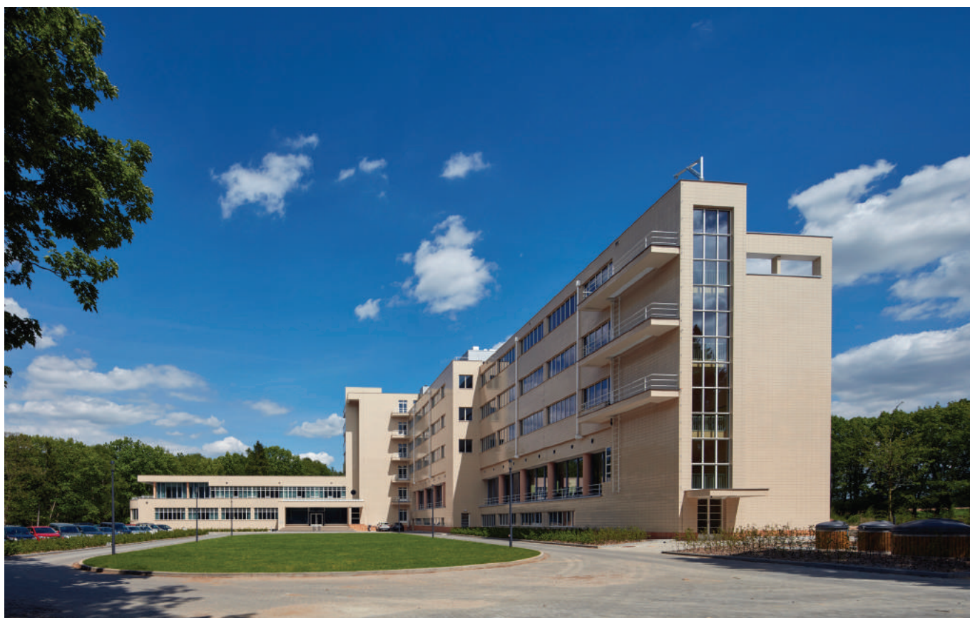
'Tombeekheyde, ooit het vroegere sanatorium, na de restauratie, uitbreiding en herbestemming.'

Op nauwelijks 20 km van Brussel herrijst een uniek icoon van het Modernisme uit zijn ruïne. In opdracht van Tombeekheyde (AG Real Estate) legt SVR-ARCHITECTS er de laatste hand aan het project 'Tombeekheyde', de restauratie, uitbreiding en herbestemming van het sanatorium uit 1936 van architect Maxime Brunfaut. Het complex wordt sinds 1993 beschermd als monument en het park als landschap. In 2009 kreeg het de erkenning als bouwkundig erfgoed.