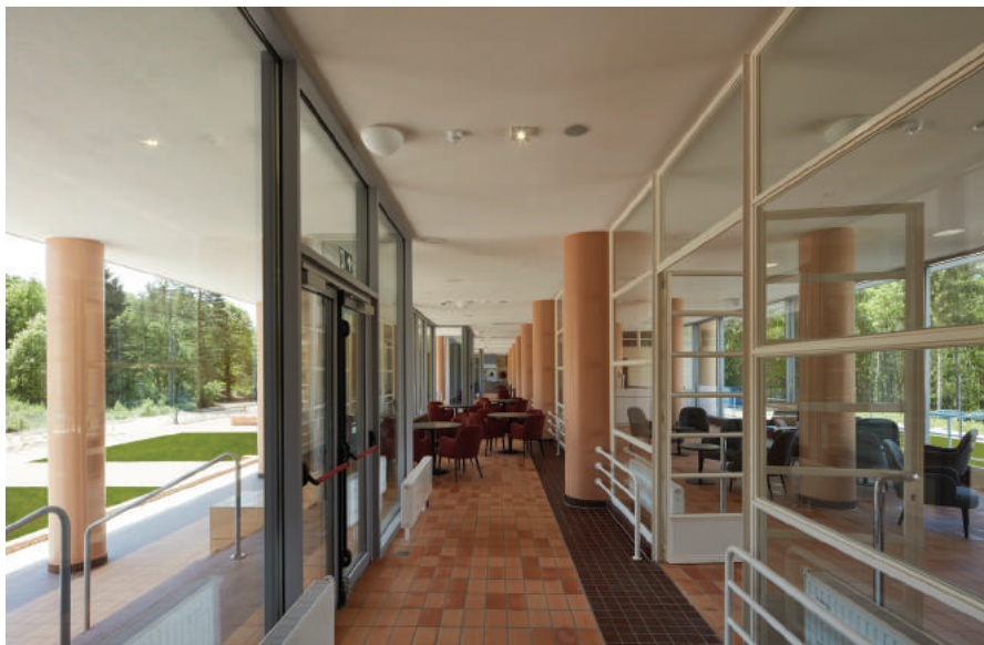
'Grand Hôtel allure.'

Dit uitgangspunt inspireerde ook SVR-ARCHITECTS voor de realisatie van het nieuwe project.