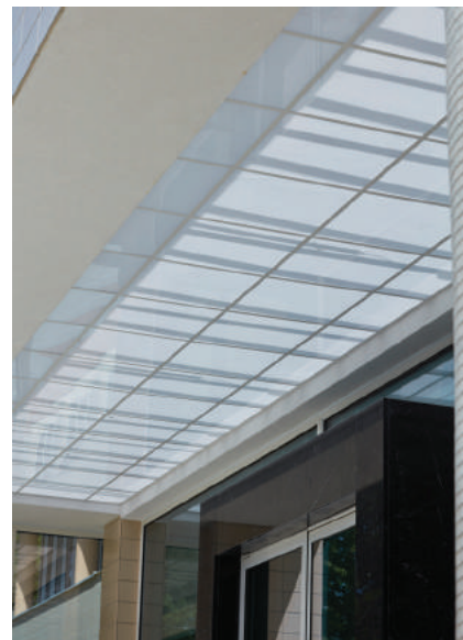
'Beglaasde luifel hoofdingang.'