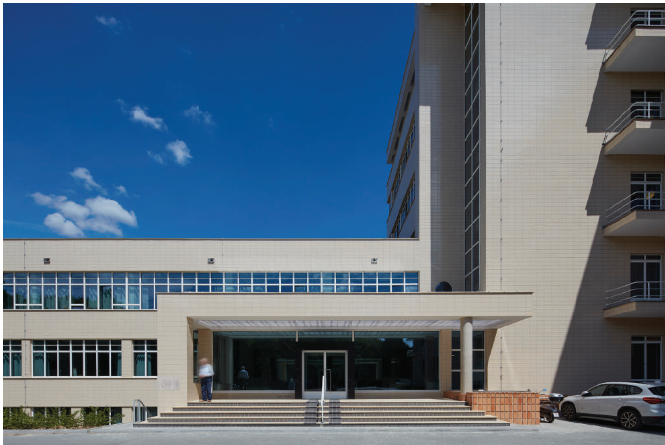
'Integrale gevelbekleding met crèmekleurige, geglazuurde tegels.'

In de uitbouw verwijzen het sober gevelbeeld, samen met het kleinere en lagere volume, naar de functie: hier bevonden zich de ondersteunende, verzorgende diensten en komen in de toekomst de polyvalente zaal voor recepties, film- en theatervoorstellingen en de ruimtes voor