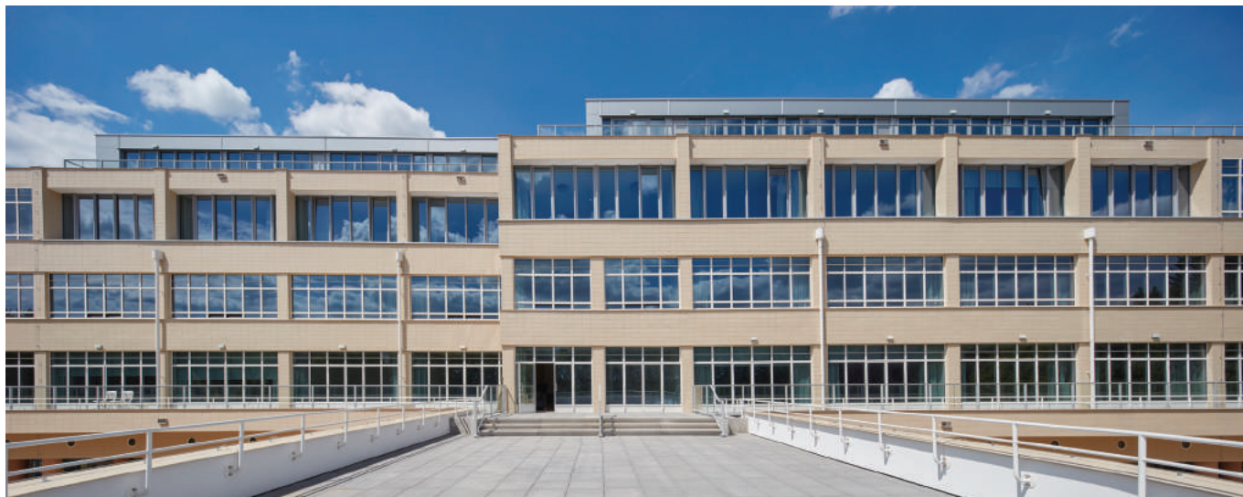
'Geïntegreerde uitbreiding in de horizontale gevelstructuur.'