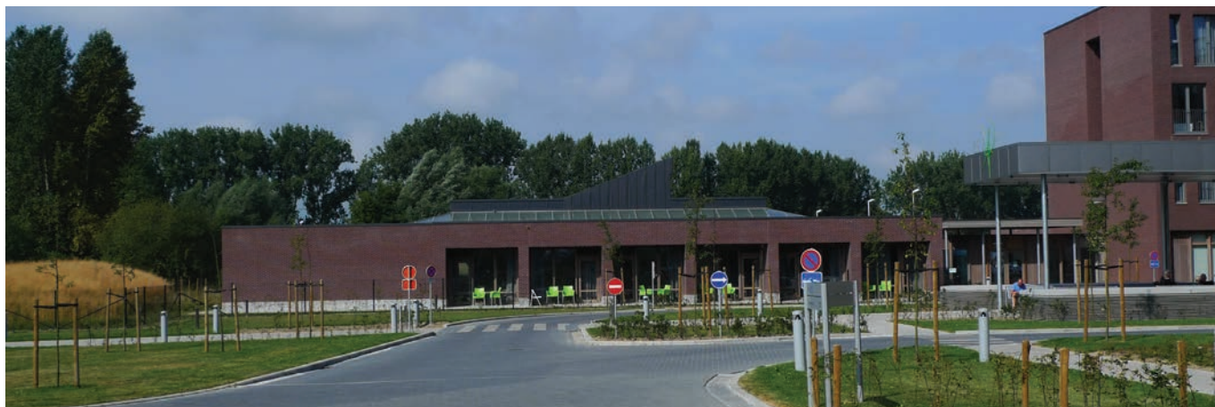
Bouwdeel 'Herbosch' is uitgewerkt als een afzonderlijk paviljoen (foto1/2)