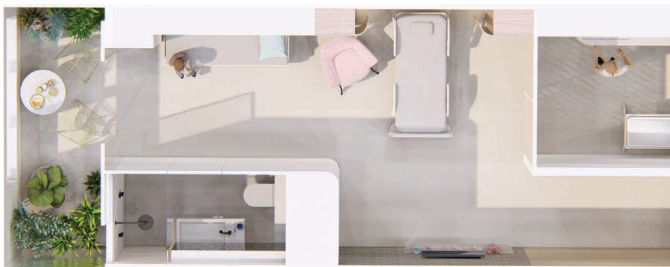
Visualisatie conceptindeling Koalakamer