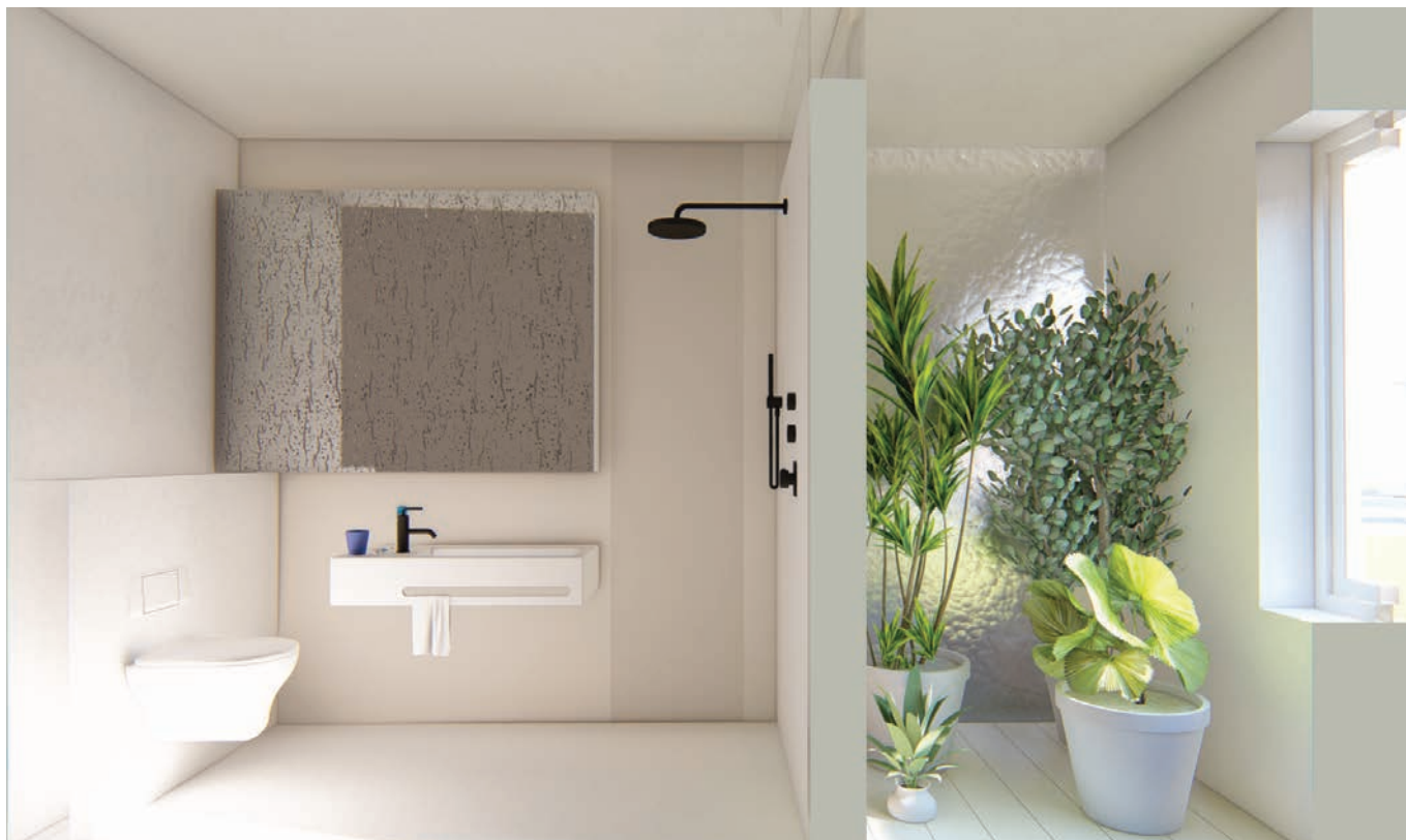
Visualisatie concept sanitairen