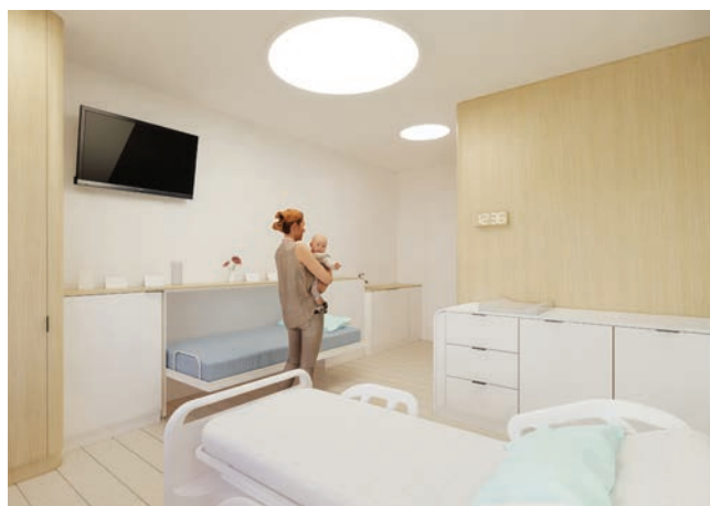
Visualisatie concept 1-persoonskamer