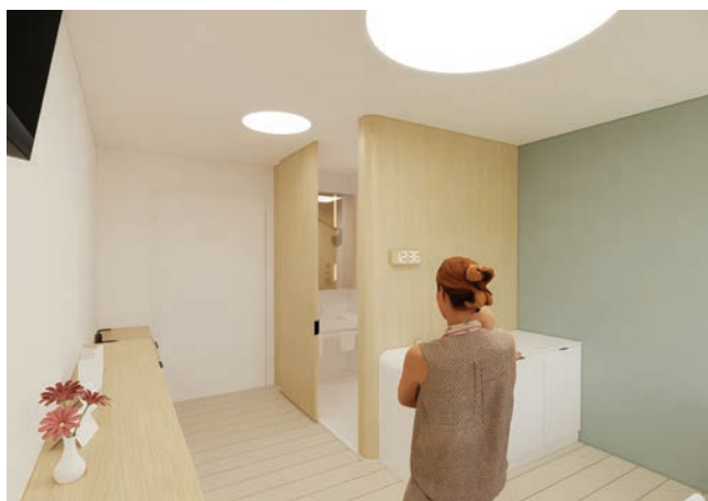
Visualisatie concept 1-persoonskamer