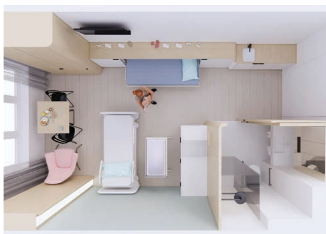
Visualisatie conceptindeling 1-persoonskamer