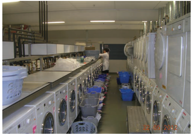
Laundry lab Q-building