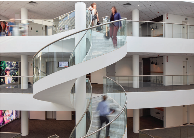
Trophal naar nieuwe kantoren N&P