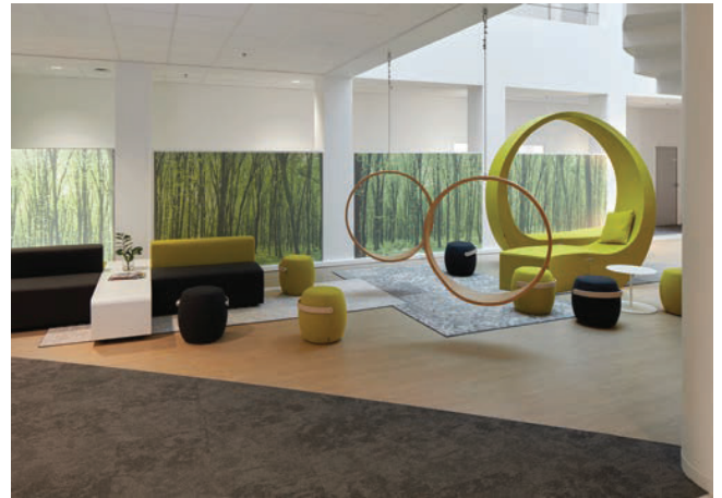
Nieuwe consumer lounge N&P