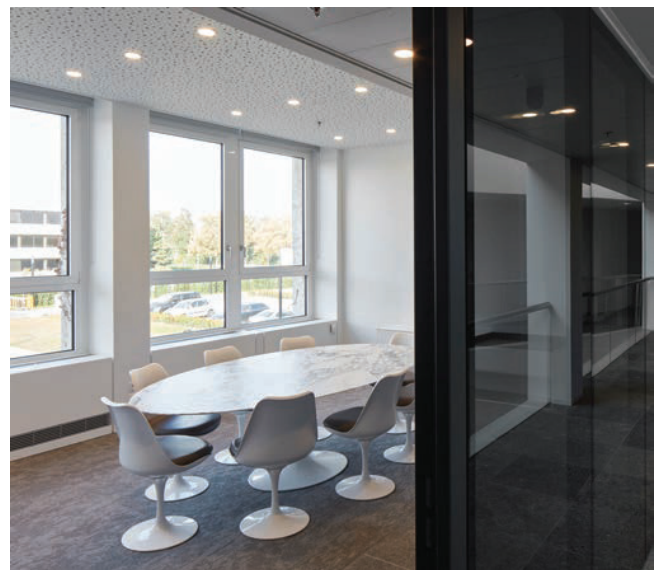
Nieuwe kantoren N&P