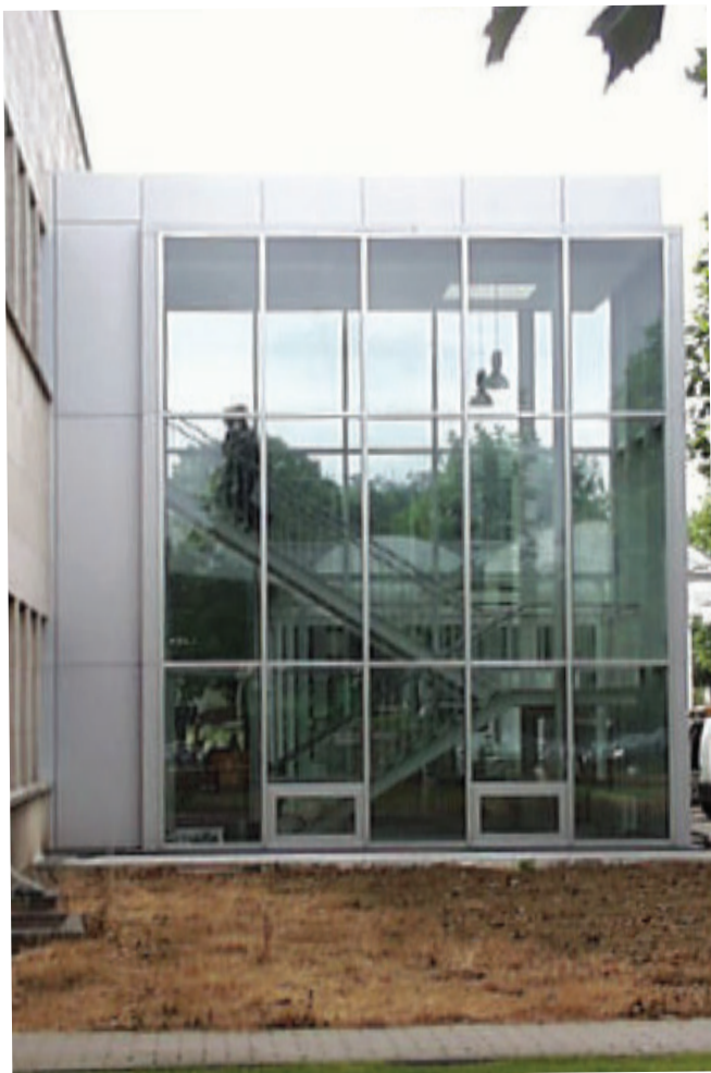
Inkomzone E-building Labo's E-building