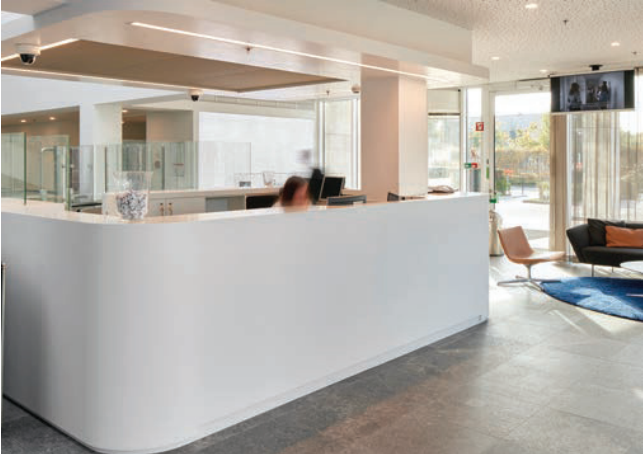
Nieuwe receptie N&P