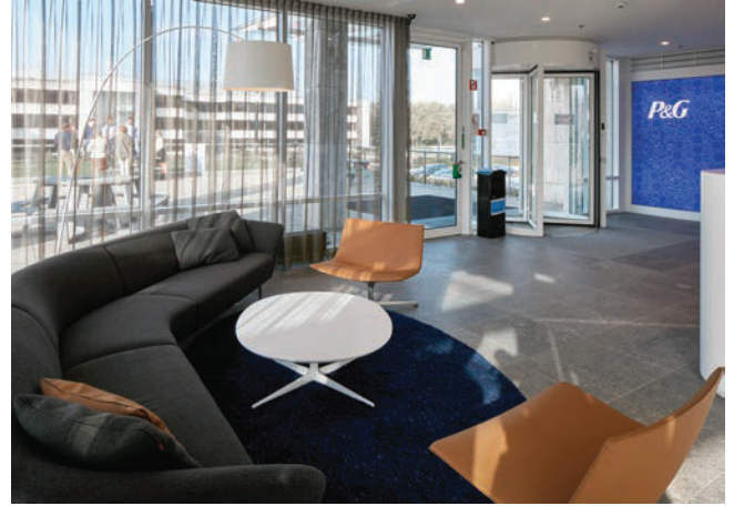
Nieuwe inkomzone N&P