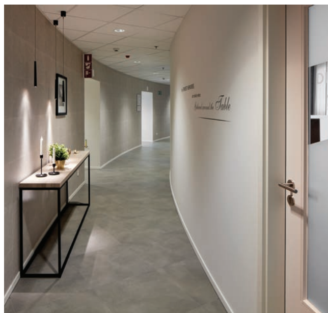
Homefeeling doorgetrokken in de gangzone van de Consumer Lounge

De nieuwe Consumer Lounge moest ook zeer uitnodigend zijn, omdat hier onderzoek wordt gedaan naar de klantenervaring en -tevredenheid, door gebruikers van P&G in een huiselijke omgeving met de P&G producten te laten omgaan en de consumers daarbij zo nauwgezet mogelijk te observeren. Het beoogde Homefeeling moet daarbij in elk geval uitsluiten dat bezoekers het gevoel zouden krijgen zich in een laboratorium te bevinden.