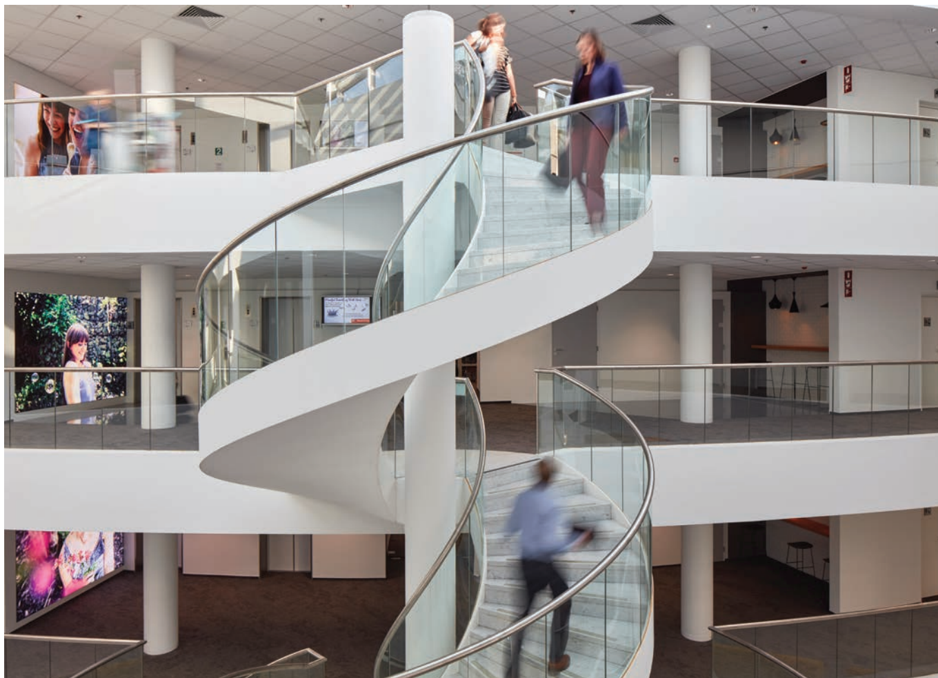
Trophal naar nieuwe kantoren N&P