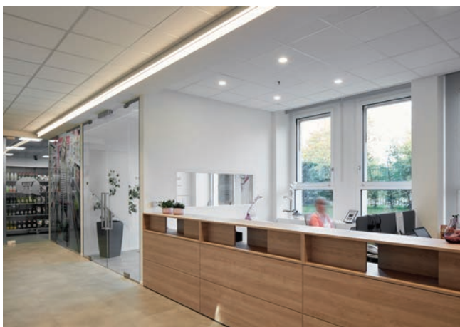
Onthaal met bijhorende shop voor observatie