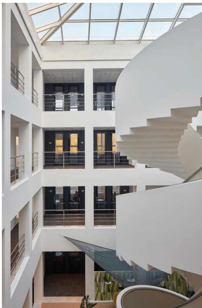
Trophal naar nieuwe kantoren N&P