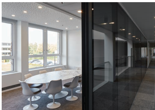
Publiek toegankelijke vergaderzalen

Gedurende meer dan 25 jaar heeft SVR-ARCHITECTS tal van opdrachten voor Procter & Gamble tot een goed einde gebracht, gaande van de constructie van warehouses en de inrichting van high end laboratoria, tot de uitrusting van een experimentele wasserij voor de ontwikkeling van talloze P&G wasproducten.