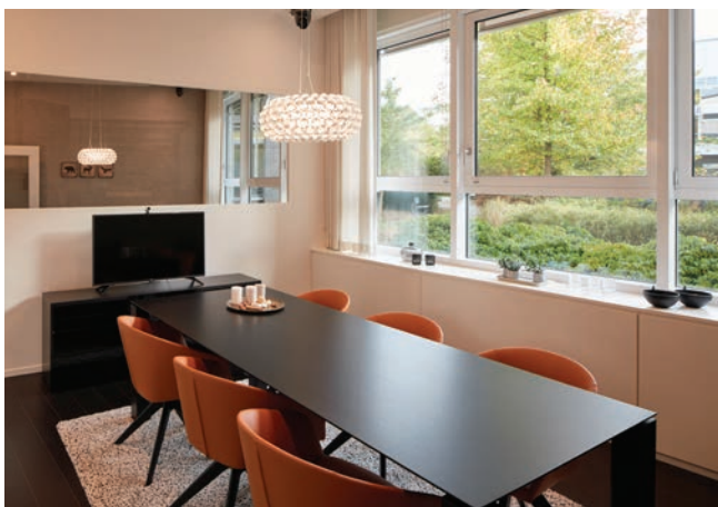
Het beoogde Homefeeling van de Consumer Lounge