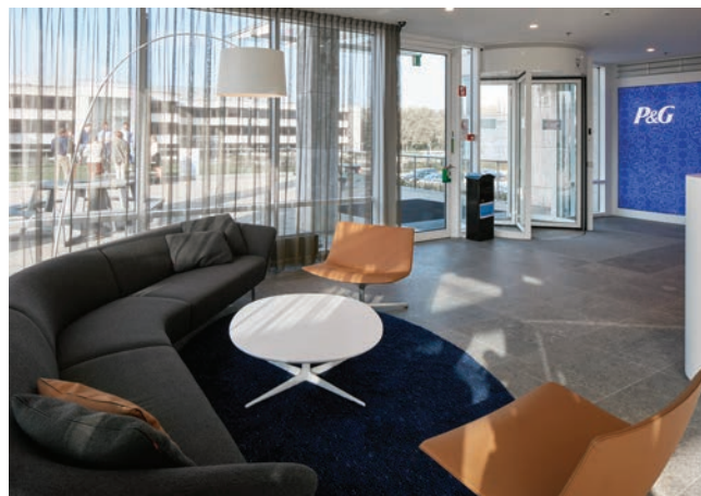
Ontvangstzone bij nieuwe receptie