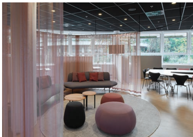
Opleidingscentrum Consumer Lounge