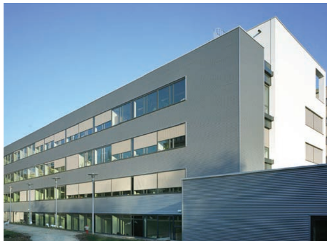
VIPA 1: Radiotherapie