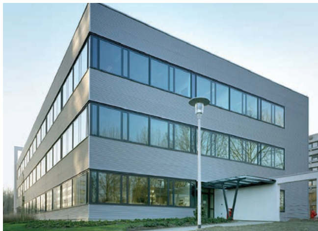
VIPA 1: Administratief gebouw