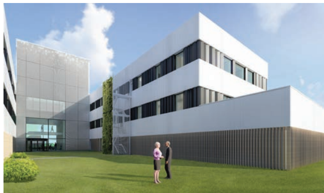
Onderzoeksgebouw en Donorcentrum Rode Kruis (gebouw J)

Onderzoeksgebouw en Donorcentrum Rode Kruis