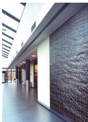
Nieuw inkomgebouw met commerciële ruimten