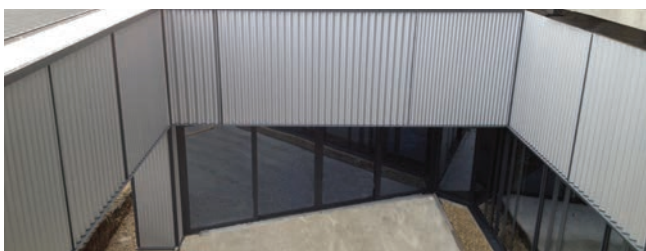
Nieuwe apotheek en magazijnen