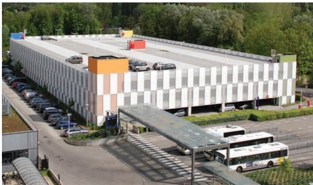
Foto parkeergebouw personeel