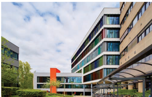
Koningin Mathilde Moeder-en Kindcentrum