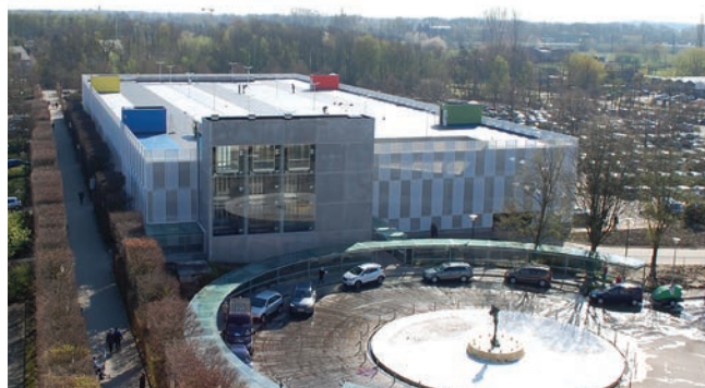
Rendering parkeergebouw bezoekers