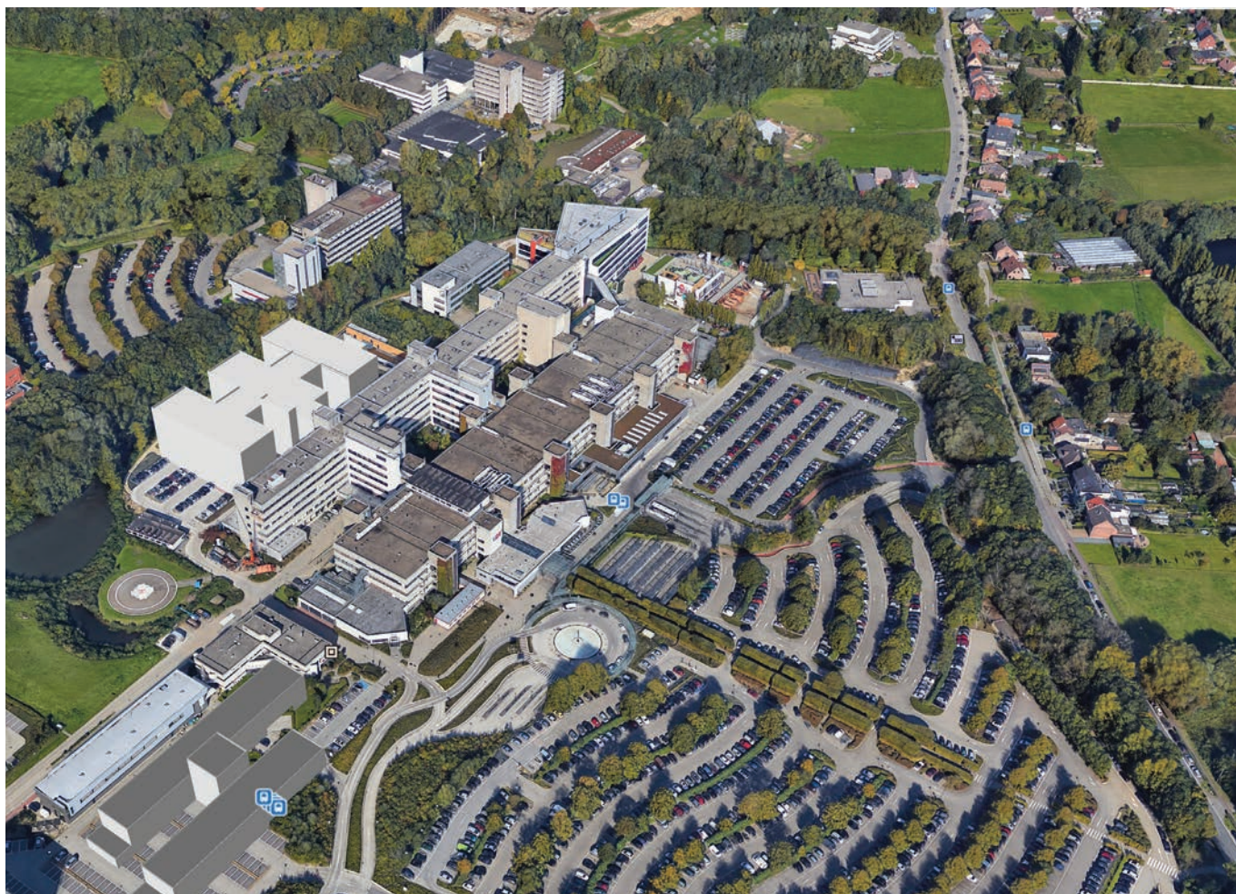
Universitair Ziekenhuis Antwerpen