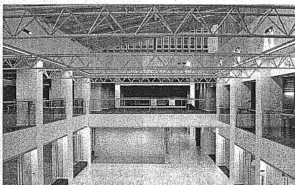
■ De renovatie van het gebouwencomplex aan de Reyerslaan verloopt in fasen. De achterkant van het nieuwe gebouw is intussen al grotendeels klaar.

De openbare omroep vernieuwt deze zomer zijn nieuwsdienst, met één inhoudelijke redactie die materiaal levert voor tv, radio en internet. Komt goed uit, want nu de VRT toch het hele Reyerscomplex aan het verbouwen is, kon er meteen een grote redactieruimte op maat worden gemaakt.