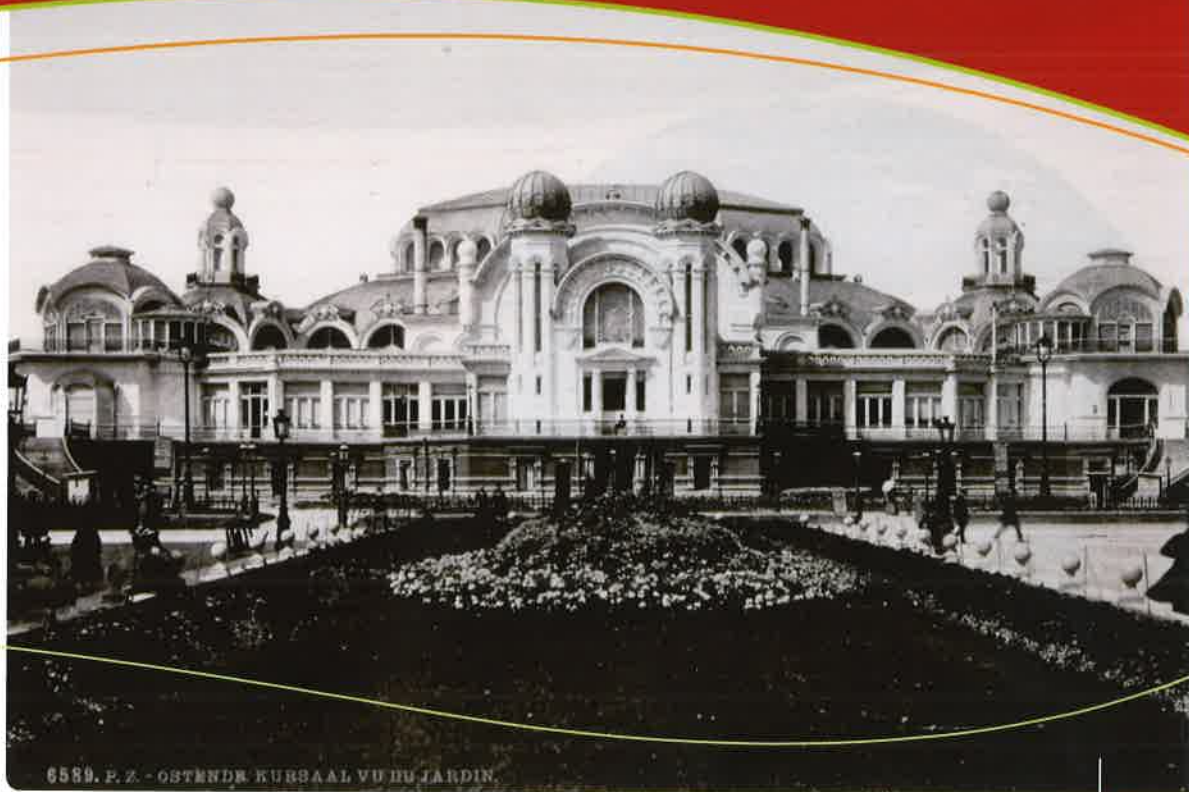
6589. P. Z. - OSTENDE. KURSAAL VU DU JARDIN.