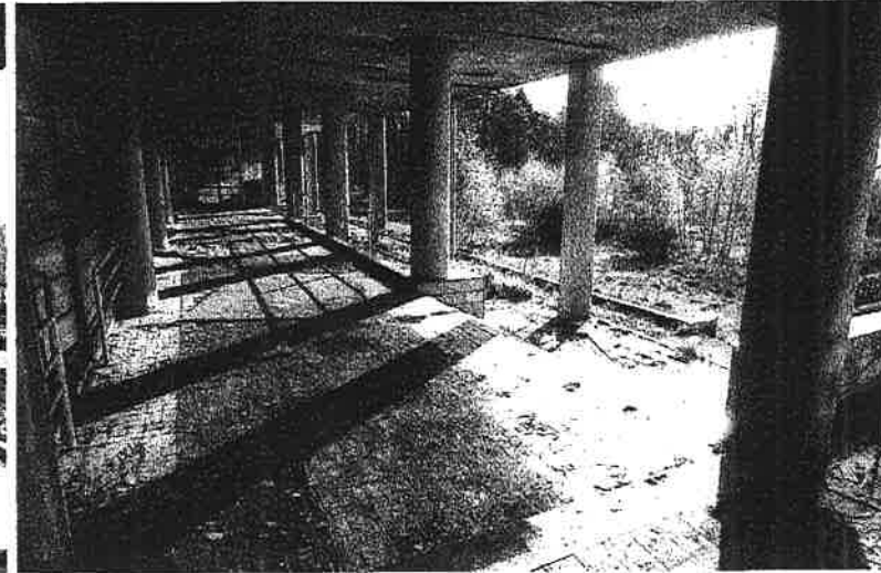
■ Het Sanatorium Joseph Lemaire vroeger en nu. Een van de meest markante gebouwen van het land werd een van de meest desolate ruïnes.