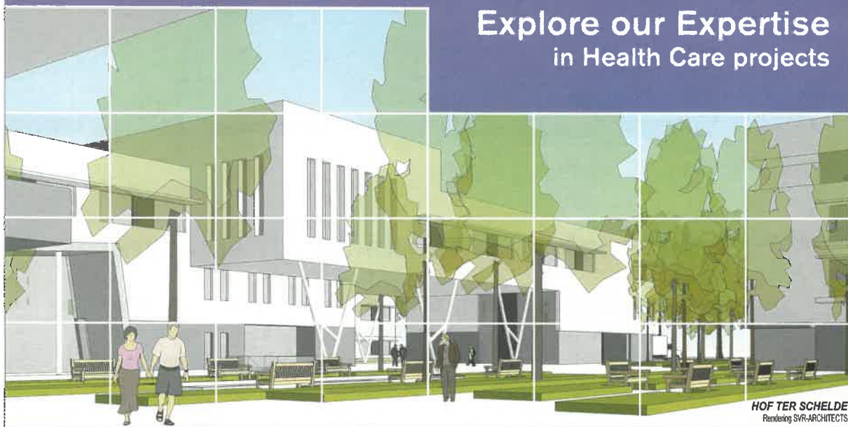
HOF TER SCHELDE Rendering SVR-ARCHITECTS

Explore our Expertise in Health Care projects